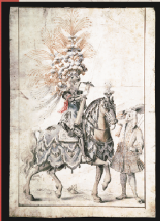
oben: Geharnischter Turnierkrieger zu Pferde mit Stechhelm und Lanze

Die Heraldik (Wappenkunde) leitet sich von den Herolden ab, die für die Einhaltung der Wappenregeln bei Ritterspielen sorgten. Turniere waren ein wichtiger Teil der mittelalterlichen höfischen Kultur.