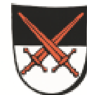
Wappen der Kurfürsten von Sachsen als Erzmarschälle des Heiligen Römischen Reichs