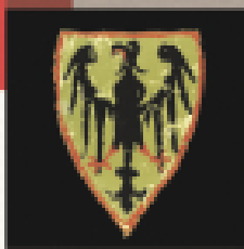
links: Wappen Kaiser Heinrich VI. (1190-1197), gilt als eines der ältesten überlieferten deutschen Wappen